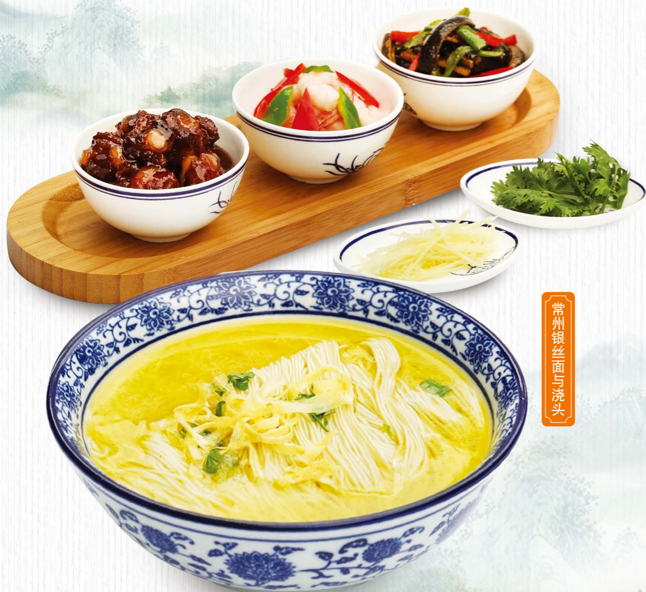
常州银丝面与浇头