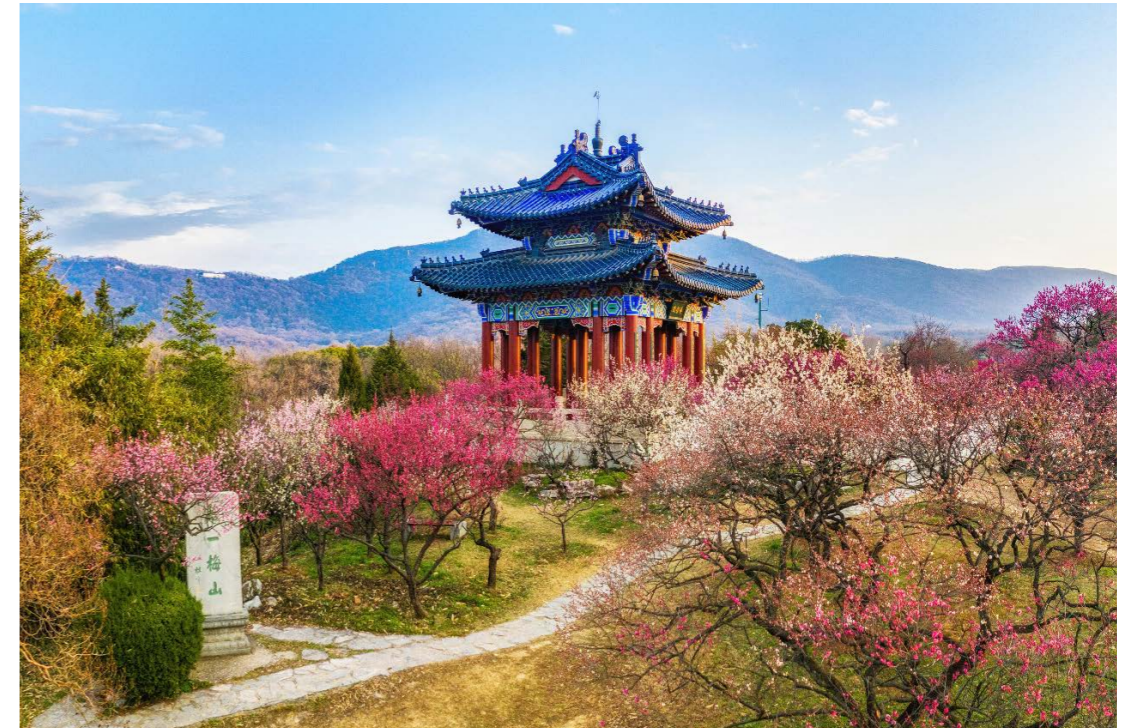
南京梅花山